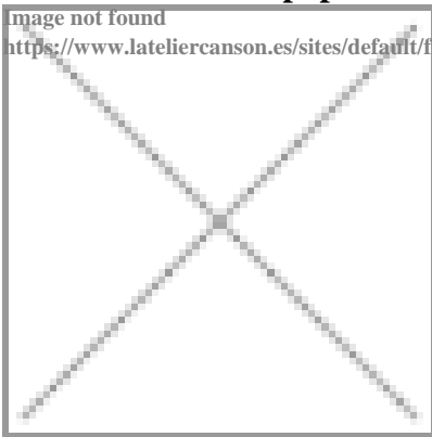
image not found https://www.lateliercanson.es/sites/default/files/styles/miniature___lire_aussi/public/Papier-3D-OEuvre-en-papier-Pas-a-pas-Mobile-en-papier-et-tige-hetre-illustrati

¿Qué es más ligero que un cielo lleno de pájaros y de nubes para crear un móvil suspendido?