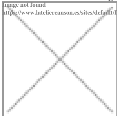
image not found https://www.lateliercanson.es/sites/default/files/styles/miniature__lire_aussi/public/Papier-3D-OEuvre-en-papier-Pas-a-pas-Pop-Up-masque-de-tigre-Illustration.jpg

Descubre, etapa por etapa, los gestos y los trucos previos a la realización de una máscara de papel con mucho volumen y al estilo Pop Up, inspirada en las colecciones de arte mexicano del museo Quai Branly.