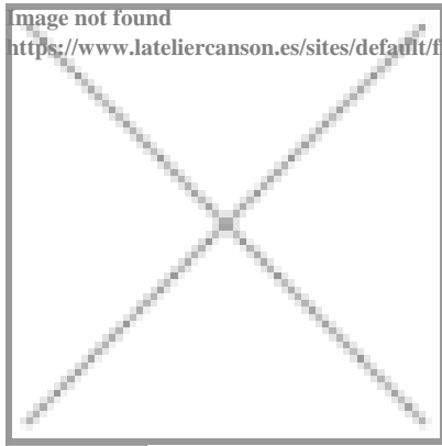
image not found https://www.lateliercanson.es/sites/all/themes/passerelle/cansonconseils/canson_commons/images/link-a-arrow.png

image not found https://www.lateliercanson.es/sites/default/files/styles/miniature___lire_aussi/public/pastel%20colorline.jpg?itok=4EmwUp6v