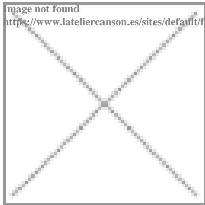
Image not found https://www.lateliercanson.es/sites/default/files/styles/miniature___lire_aussi/public/pastel%20colorline.jpg?itok=4EmwUp6v