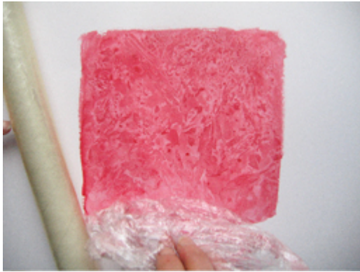
Con film alimentario: